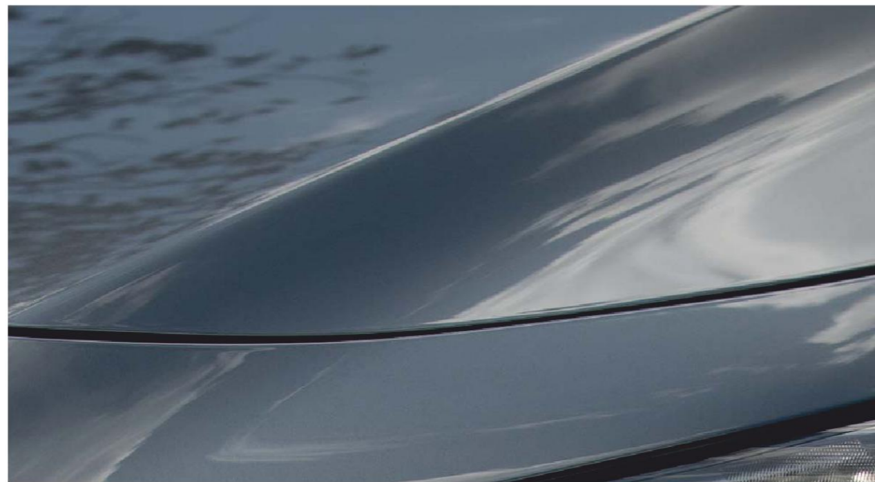
Sivá Machine Gray

Celú ponuku našich žiarivých farieb si môžete pozrieť na našich webových stránkach.