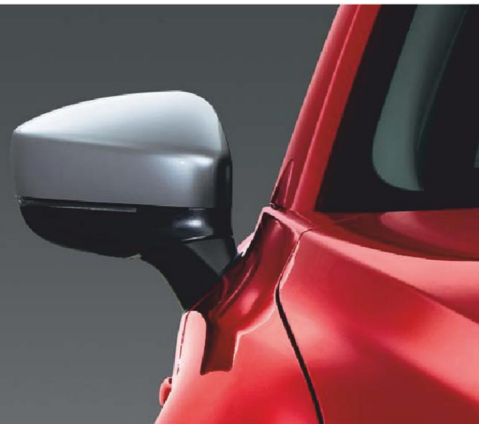
Strieborné kryty vonkajších spätných zrkadiel

Spoločnosť Mazda vytvorila dômyselné doplnky, ktoré budú dokonale vyhovovať vášmu modelu Mazda CX-5.