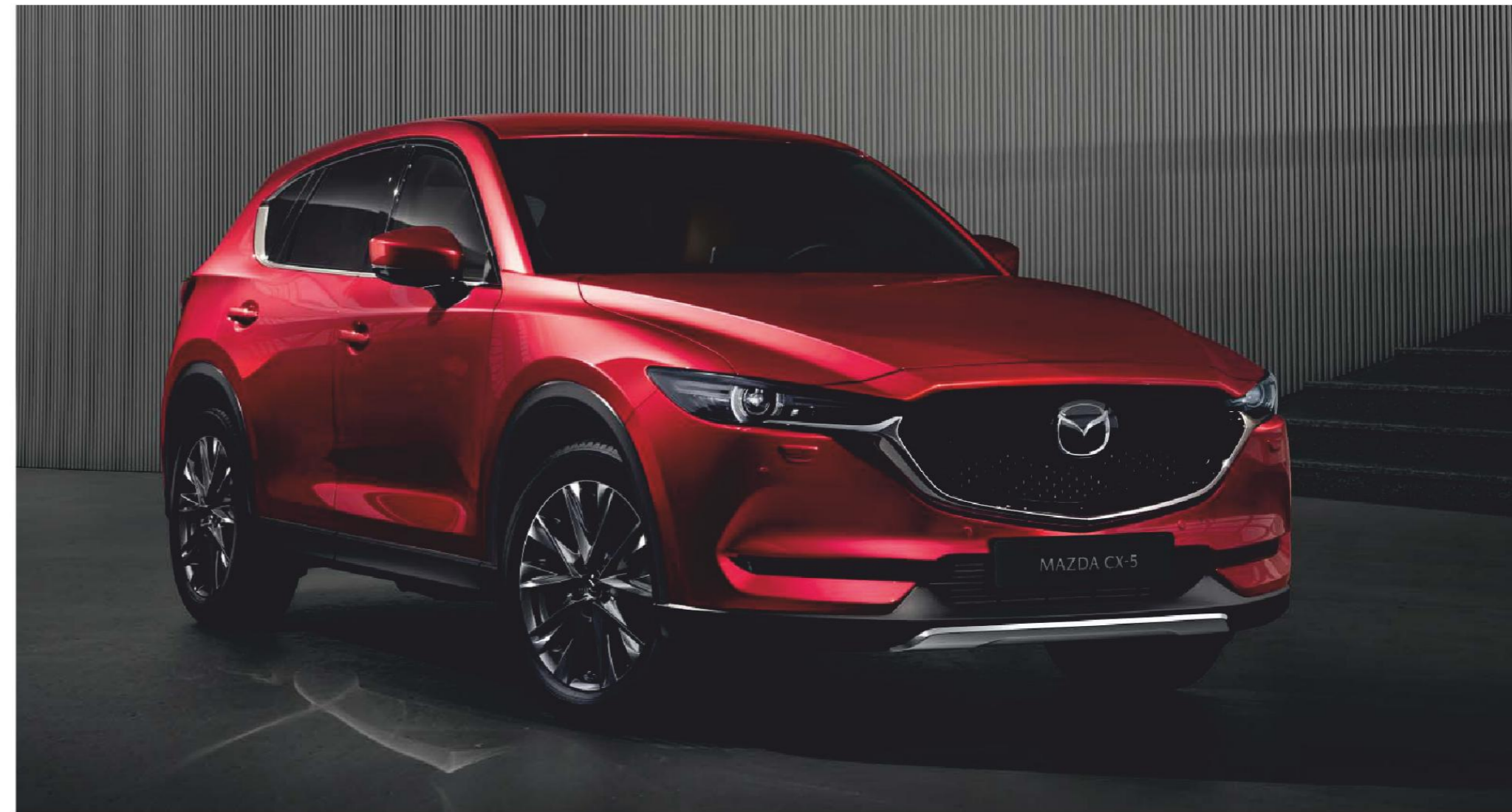
Spodné obloženie predného spojlera